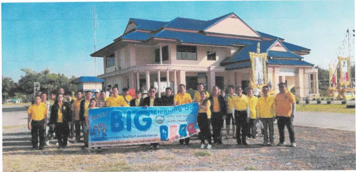
ภาพประกอบโครงการ Big cleaning day

เทศบาลตำบลตะกุด ได้ดำเนินการโครงการตามเทศบัญญัติงบประมาณ ปี ๒๕๖๓ ในเขตพื้นที่ โดยได้รับความร่วมมือ การส่งเสริมและสนับสนุนจากภาคประชาชน ภาครัฐ และภาคเอกชนในพื้นที่ตลอดจนโครงการต่างๆประสบความสำเร็จด้วยดี ก่อให้เกิดประโยชน์แก่ประชาชนทั้งในพื้นที่และพื้นที่ใกล้เคียง โดยมีผลการดำเนินงานที่สำคัญ ดังนี้