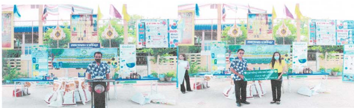
ภาพประกอบโครงการสัตว์ปลอดโรคคนปลอดภัยจากโรคพิษสุนัขบ้า