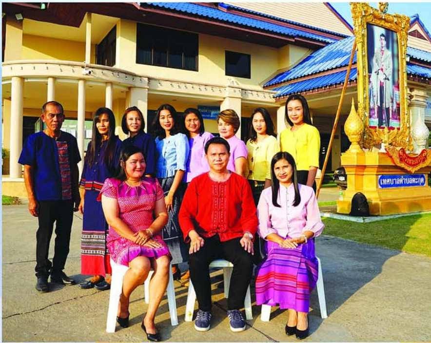
สำนักปลัดเทศบาล