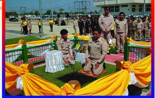
พิธีปลูกต้นไม้มงคลพระราชทานในโครงการ “1 จังหวัด 1 ถนนเฉลิมพระเกียรติ” ซึ่งจัดทำขึ้น เพื่อเฉลิมพระเกียรติ